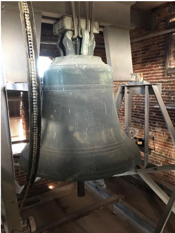
Klok in toren van De Burght